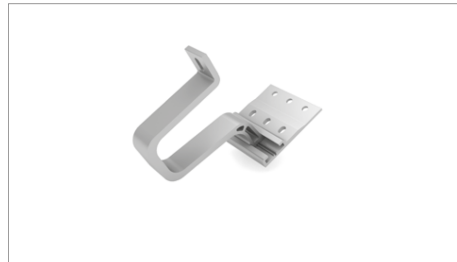
Detail Abbildung - SingleHook 1.1 - AL