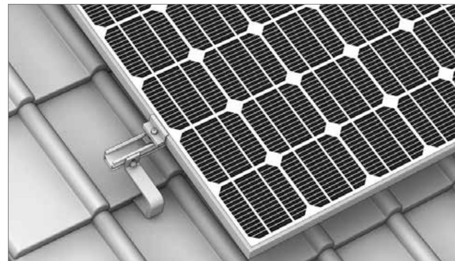
System Abbildung - Montage SingleHook - SingleRail System